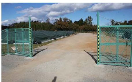
繁岡地区仮置場 2013年12月4日