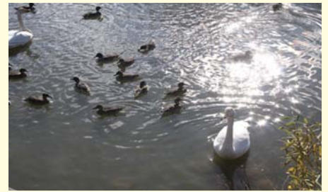
上繁岡大堤 白鳥の館 2013年12月3日 今年も上繁岡大堤、白鳥の館に白鳥が戻ってきました。除染工事も終了し、優雅な姿を湖面に映していました。