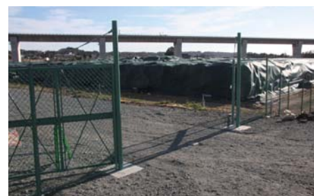
大谷地区仮置場 2013年12月4日