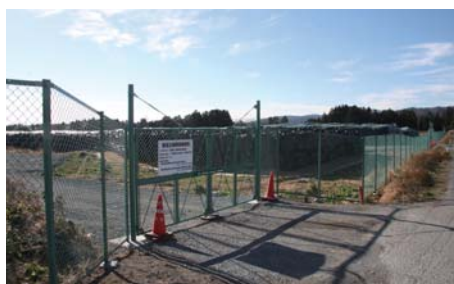
上繁岡地区仮置場 2013年12月4日