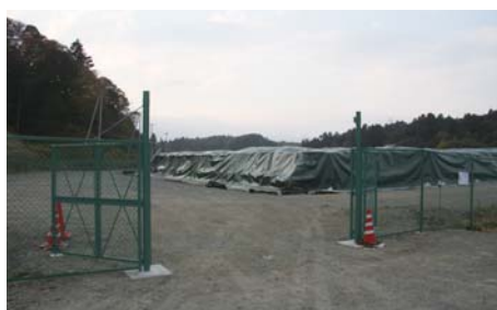
波倉地区仮置場 2013年12月4日