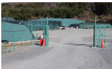
松館地区仮置場 2013年12月4日