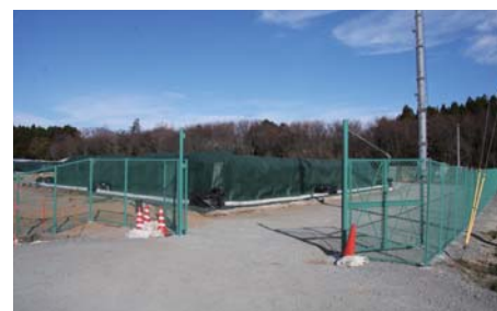
下繁岡地区仮置場 2013年12月4日