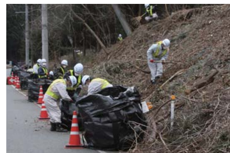
■森林の除染(35号線沿い) 2013年1月30日