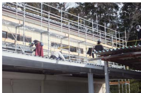
■家屋の除染(繁岡地区) 2013年1月19日

降雪により屋根や庭等に雪が残っている場合には、雪を除去してから除染作業を行っています。