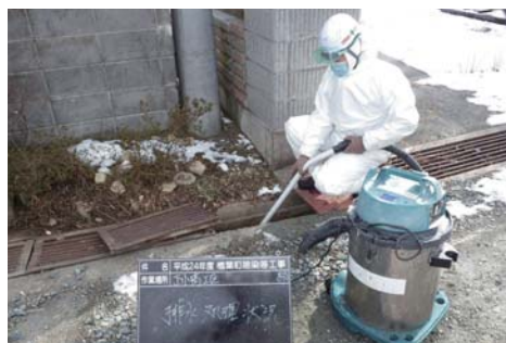
■排水の処理状況(下小埜地区) 2013年1月18日

降雪により屋根や庭等に雪が残っている場合には、雪を除去してから除染作業を行っています。