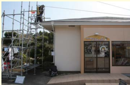
レストランの除染(繁岡地区) 2013年4月16日

繁岡地区のならばレストランで除染作業が始まりました。店舗の雨樋(堅樋)について堆積物を除去した後、高圧水洗浄を行っています。