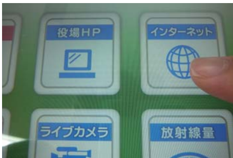
①「インターネット」をタッチします。

楢葉町より貸し出されているタブレット端末でも楢葉クリーン WEBかわら版」が閲覧できます。