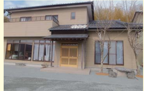
住宅除染工事(繁岡地区) 2013年3月30日

上小埜・榎ノ木下・下小埜地区の日暮国有林内に新たに2カ所目の仮置場が設置されます。