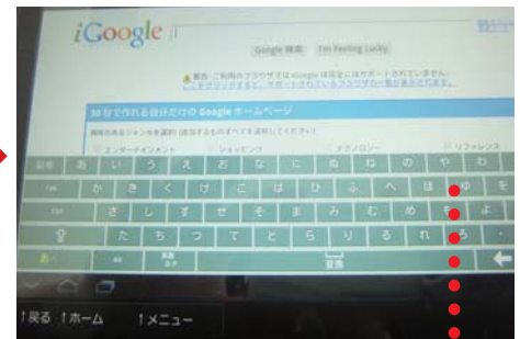
③検索例：検索ワードを入力します。 入力後「検索」をタッチします。