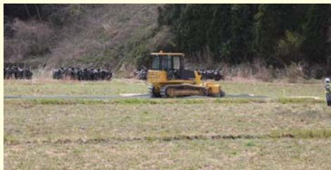
上井出地区仮置場 2013年4月16日

25年度対象地区の仮置場は、上井出・下井出・前原・山田浜・山田岡のそれぞれの地区に1カ所ずつ、北田地区には2カ所設置されます。