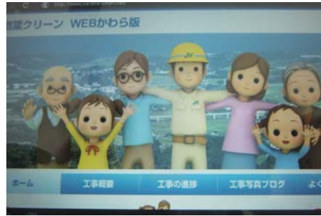
⑤「楢葉クリーンWEBかわら版」では、工区 ごとの工事写真などを見ることができます。

「楢葉町 かわら版 ("ならばまちかわらばん" でもOK)」 と入力してください。