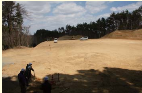
仮置場の造成(上小埜地区) 2013年4月1日

繁岡地区のならばレストランで除染作業が始まりました。店舗の雨樋(堅樋)について堆積物を除去した後、高圧水洗浄を行っています。